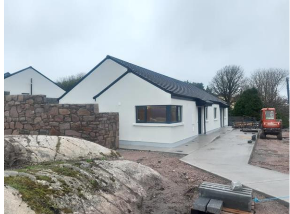
Aonaid Ilghnéitheacha – An Cheathru Rua

Thar thréimhse an HDAP seo cuimseoidh Comhairle Chontae na Gaillimhe soláthar tithíochta atá oiriúnach do dhaoine scothaosta. Oibreoidh an Chomhairle i dtreo an tsoláthair áit a bhfuil gá le leibhéal níos airde cúraim, lena n-áirítear cúinsí soghluaisteachta, socrúithe tacaíochta cúraim, athlonnú go teach níos oiriúnaí. Go ginearálta déanfar soláthar do dhaoine scothaosta a ionchorprú i ngach eastát nua a thógfaidh an tÚdarás Áitiúil. Tá 360 iarratasóir os cionn 65 bliain d’aois ar an liosta reatha tithíochta sóisialta do Ghailimh, mar atá léirithe sa tábla thíos. Is ionann é sin agus 10.5% den éileamh iomlán tithíochta do Chontae na Gaillimhe. Oibreoidh Comhairle Chontae na Gaillimhe le go mbeidh an céatadán seo de na foirgnimh nua go léir aois-chairdiúil ag féachaint do shuíomh gach foirgneamh nua agus an riachtanas míchumais ar leith sa limistéar sin.