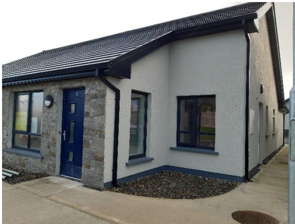
Aonaid Ilghnéitheacha - An Gort