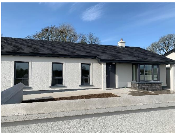
Cosáin Rochtana Leibhéal i gCreachmhaoil Gort