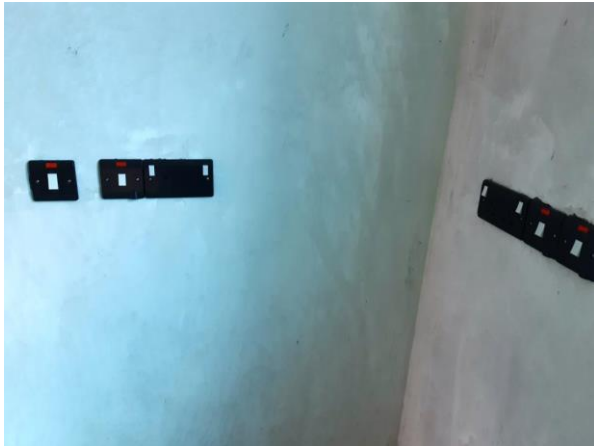
Lasca dorcha-daite chun cabhrú leo siúd a bhfuil lagú amhairc orthu