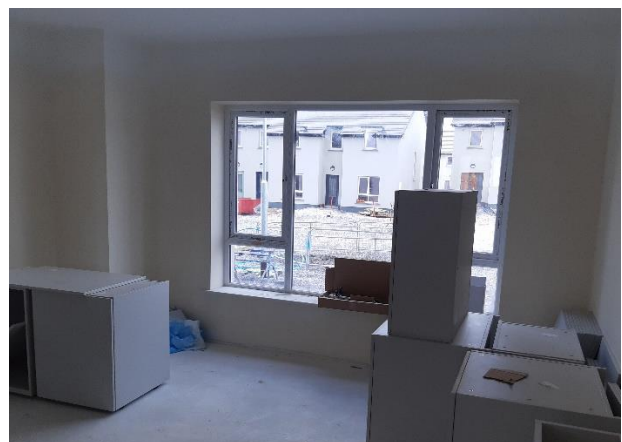
Fuinneoga níos mó = leibhéal arda solais, Bóthar an Tobair,