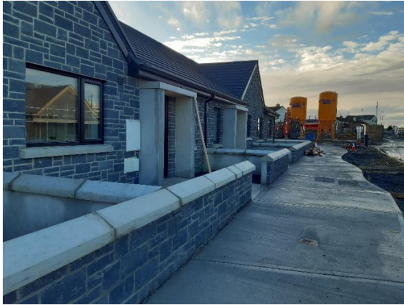
Rochtain comhréidh i bhFána Bhui i dTuaim

Bearta tugtha chun feidhme ag Comhairle Chontae na Gaillimhe chun cáilíocht na beatha agus inoiriúnaitheacht a fheabhsú: