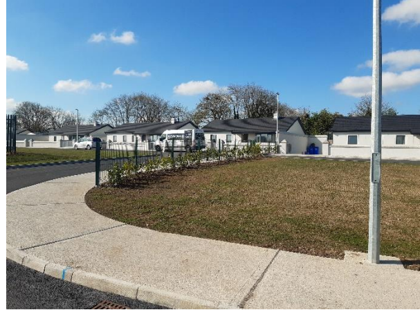
Grúpscéim Tithíochta nua don Lucht Siúil i gCreachmhaoil